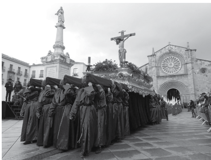
Celebração sacra na cidade de Ávila, que é banhada pelo Rio Adaja