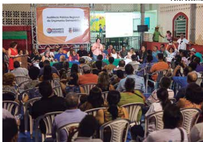
A audiência contou com a participação de mais de 200 pessoas

importância deste novo instrumento de trabalho com a população. “Através do Orçamento Democrático Municipal, a população diz quais são as prioridades da sua região. Através destas informações, é criado um canal de contato direto da gestão com o povo, o orçamento nada mais é que um instrumento de democracia que abre espaço para o povo falar e construir junto com a gestão”, disse.