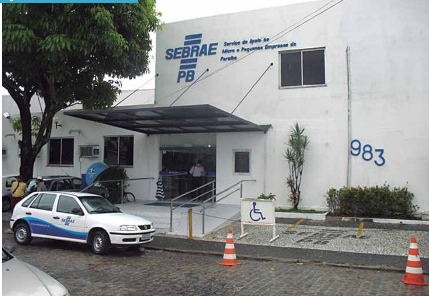
As inscrições podem ser feitas nas agências de João Pessoa, Campina Grande, Guarabira, Araruna, Monteiro, Pombal, Patos, Sousa, Cajazeiras e Itaporanga