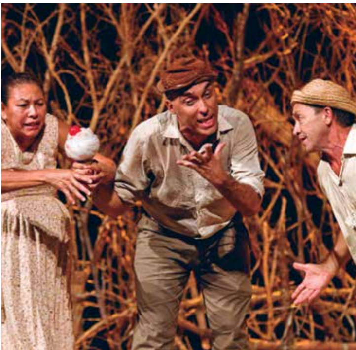
Espectáculo Como nasce um cabra da peste marcou a volta do Santa Roza

É exigido, para a reserva de pauta no teatro, um prazo mínimo de 30 dias de antecedência do evento. O prazo de confirmação do agendamento é de 72 horas. Caso a documentação para abertura do processo não seja entregue no prazo, o agendamento é cancelado. O valor da pauta para espetáculos de grupos artísticos locais (com co-