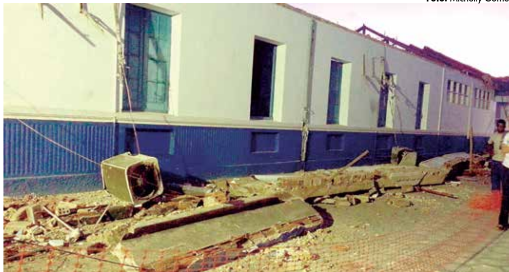
Beiral de uma parede do colégio onde estão sendo realizadas obras desabou na última sexta-feira