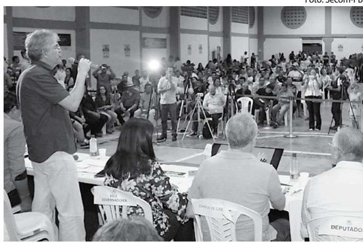
Audiência do ODE contou com a participação de 1.565 pessoas

O Vale do Piancó, além de estradas, está sendo beneficiado com obras hídricas. A Estação de Tratamento de Água de Itaporanga tem previsão de ser entregue em junho. Os municípios de Pedra Branca e Nova Olinda também serão assistidos com ETAs. Em relação à adutora de Diamante e Boa Ventura, a previsão de conclusão da obra é em julho.