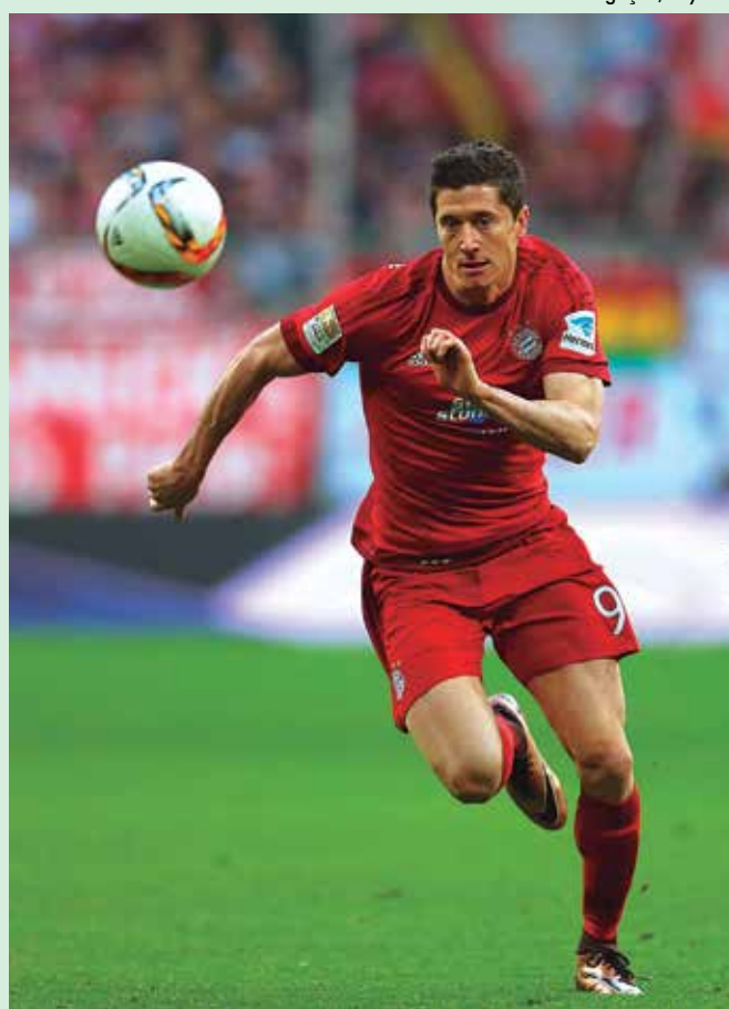
Atacante do Bayern sofreu uma pequena lesão no ombro direito

No último sábado, na vitória do Bayern por 4 a 1 sobre o Borussia Dortmund, Lewandowski marcou dois gols. Só que, no lance do pênalti sofrido, ele caiu sobre o ombro direito e sentiu muitas dores. Ainda assim,