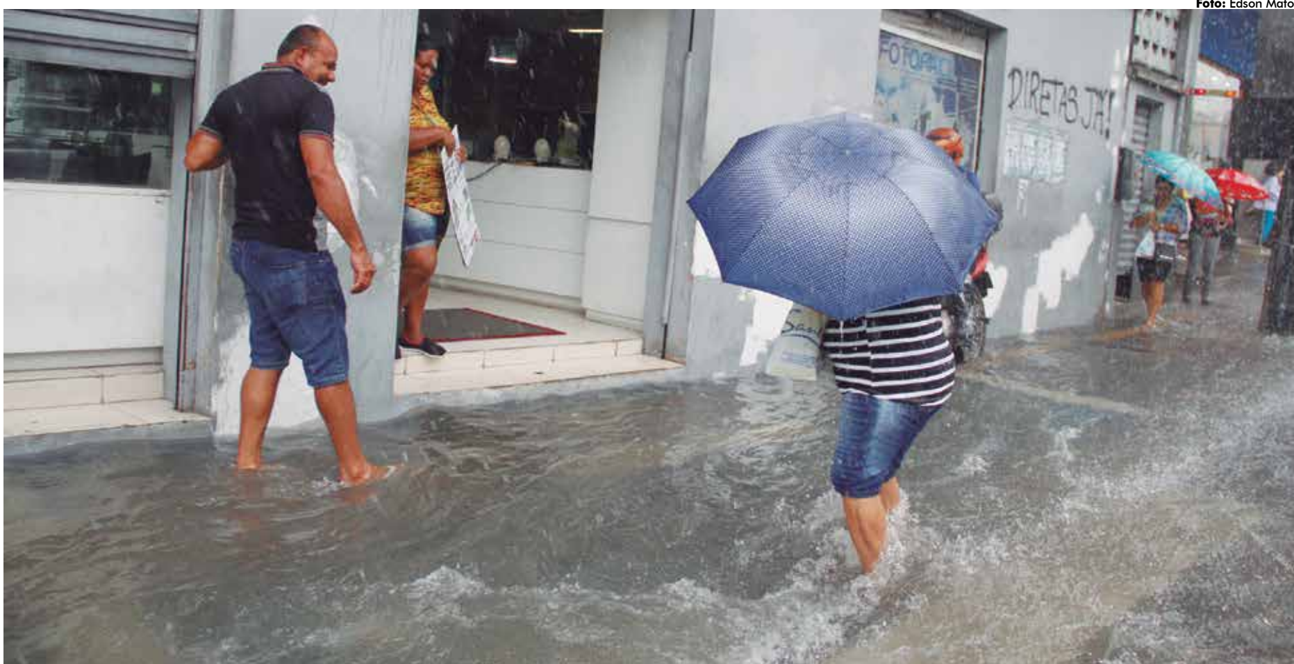
No centro da capital, as águas que se acumularam nas ruas dificultaram a locomoção dos pedestres, que tiveram que enfrentar até correnteza, e prejudicaram as vendas nas lojas