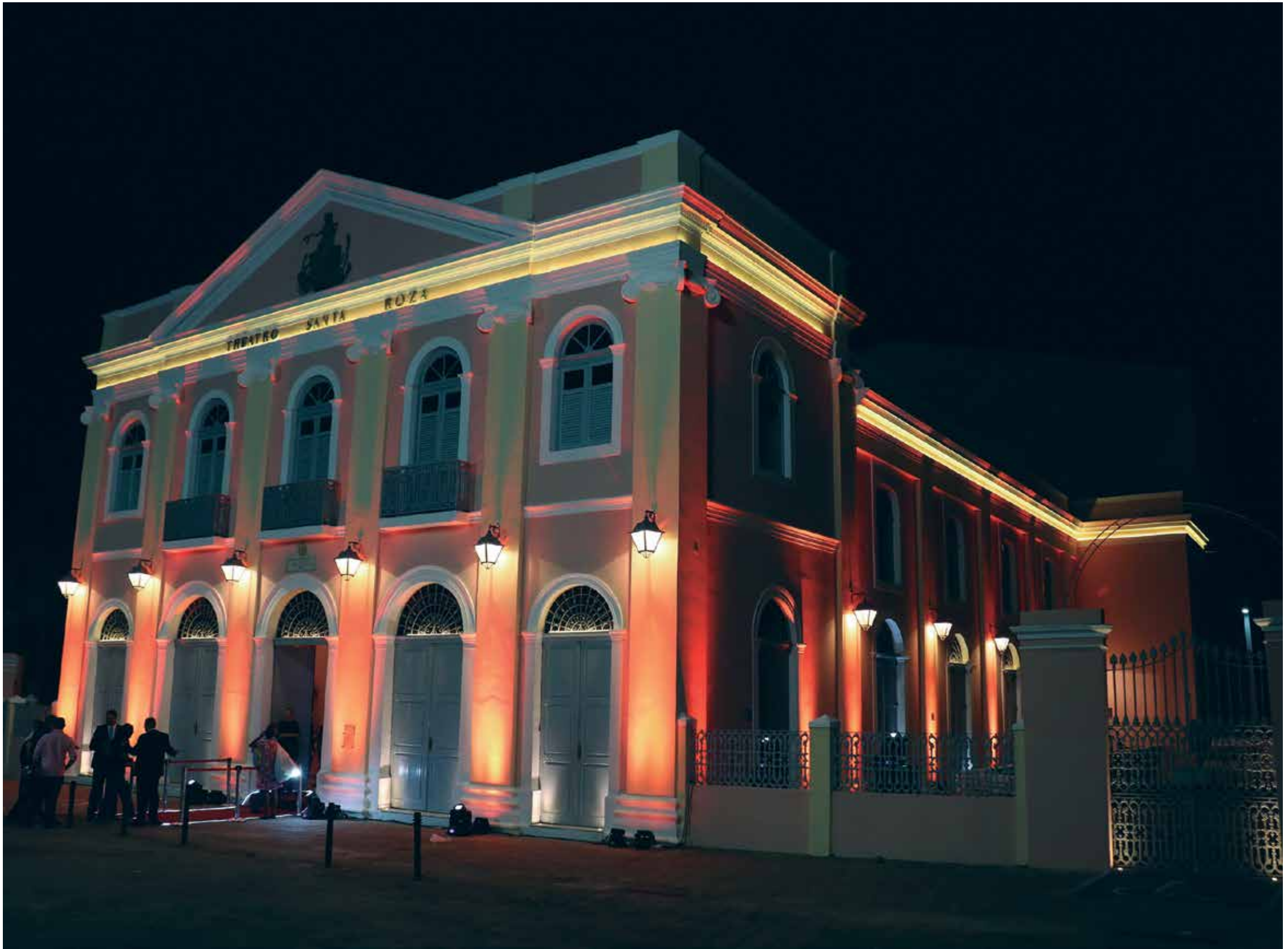
A fachada de uma das mais tradicionais casas de espetáculos da Paraíba, que foi totalmente restaurada pelo Governo do Estado e entregue à população, proporcionando que o equipamento volte a receber grandes produções