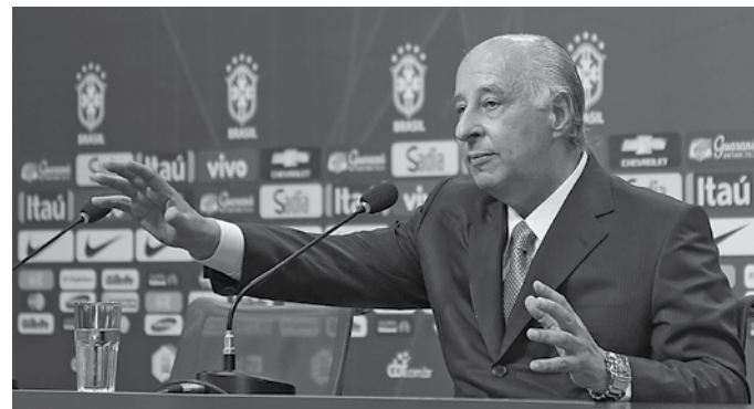
Movimento de insatisfação de alguns clubes preocupa o presidente

Enquanto isso, o deputado federal Otávio Leite ainda aguarda resposta do Ministério Público Federal à representação contra a entidade por ter realizado