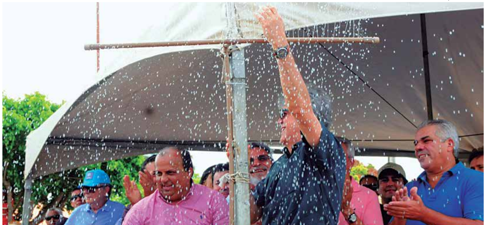
Princesa Isabel Governo do Estado entrega ampliação do sistema de abastecimento de água da cidade; foram investidos R$ 8 milhões. Página 3

Ministro do Supremo Tribunal Federal autorizou investigação no âmbito da Operação Lava Jato contra 29 senadores, 42 deputados, 10 ministros e 3 governadores. Página 14