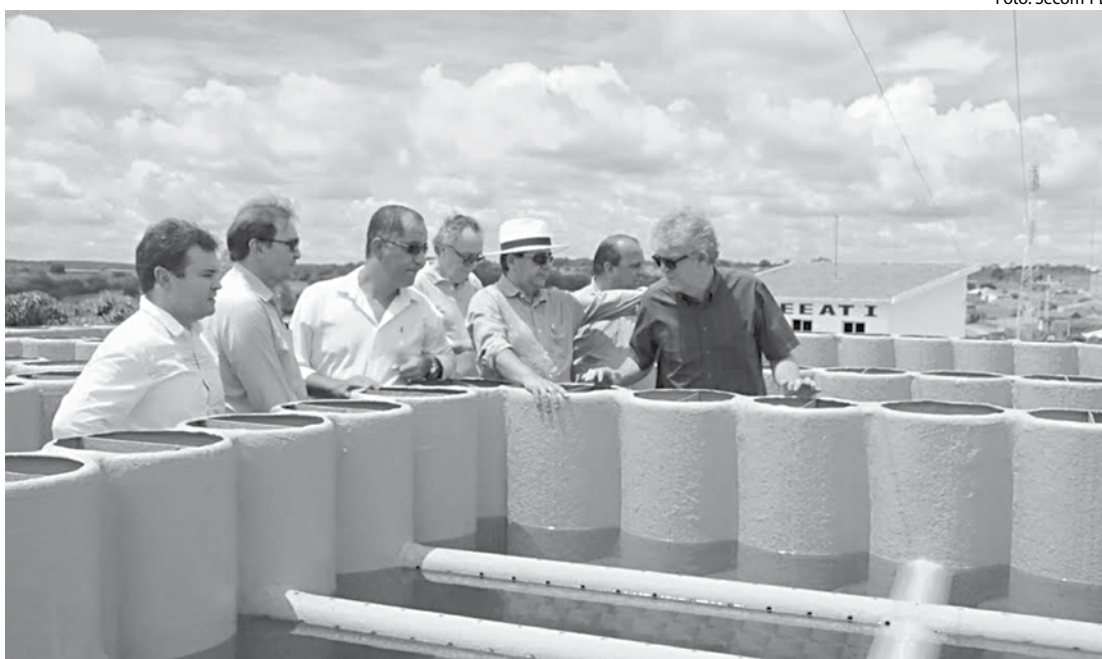
Vazão do novo sistema que passa a abastecer a região de Princesa é de 35 litros por segundo de água tratada