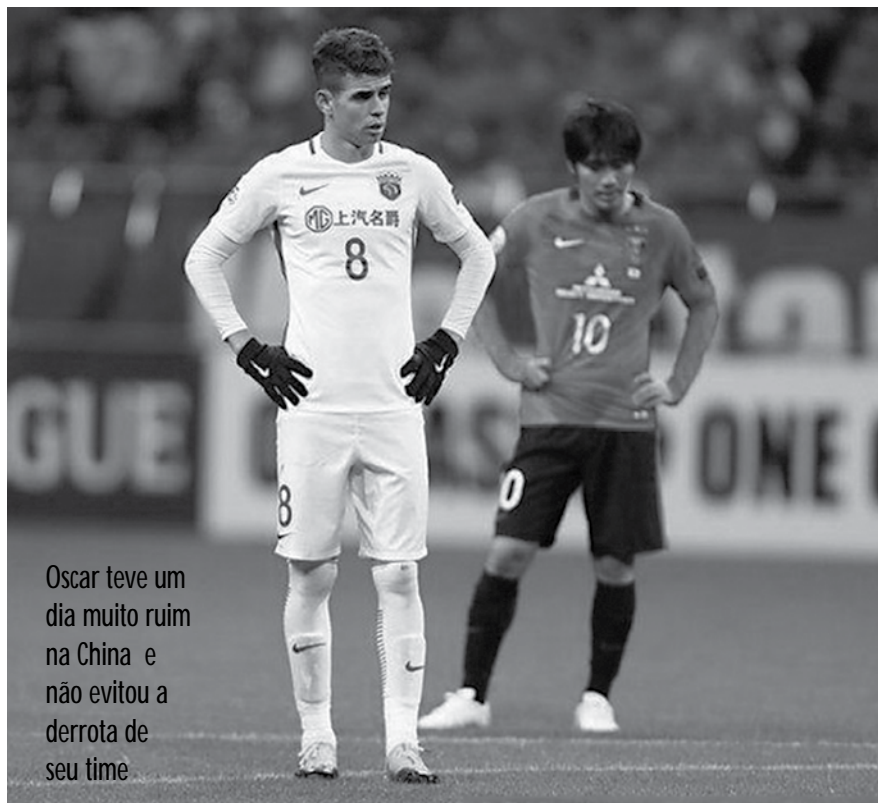
Oscar teve um dia muito ruim na China e não evitou a derrota de seu time